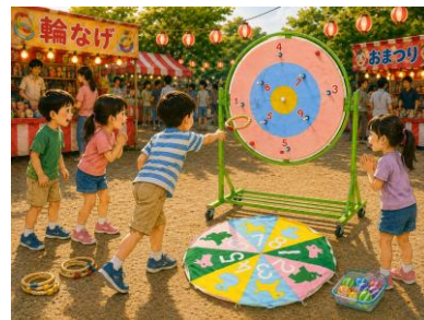
回転まとあてゲーム