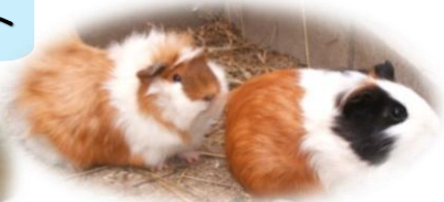
アビシニアンモルモット イングリッシュモルモット