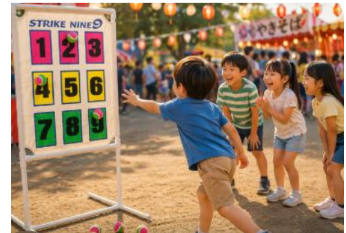
ストラックナイン